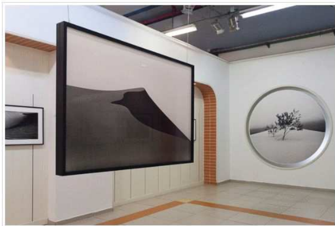
בתערוכה של ג'ון פפר.

בין תערוכות הצילום נמצא גם את התערוכה היפה של ג'ון פפר, צלם איטלקי ששייך למסורת הצילום הפיקטוריאלית. פפר מצלם מדבריות במקומות שונים בעולם וגם אצלנו בנגב. הוא מצלם במצלמת לייקה אנלוגית וגם מדפיס את הצילומים באופן אנלוגי – סגנון שהולך ונעלם ונותן אופי חומרי ייחודי לצילומיו. גרעיניות הפילם בו משתמש מהדהדת בגרגרי החול בדיונות המצולמות.